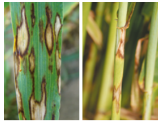
À gauche : attaque de rhynchosporiose sur feuille. À droite : attaque de rhynchosporiose sur tige

Taches irrégulières, à centre clair et à périphérie brun foncé sur les feuilles et les ligules. Elles finissent par se rejoindre et s'imbriquer les unes dans les autres.