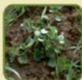
véronique F. de lierre

PICOsolo ® , votre anti-dicot. à associer (*) aux spécialités anti-graminées / dicots nécessitant un complément pour un large spectre d'efficacité