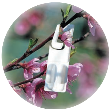
Diffuseur de Rak® 5.