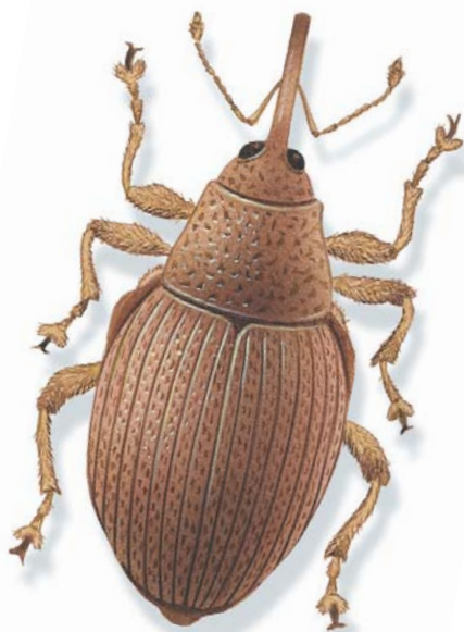
Le charançon de la tige Ceutorhynchus napi