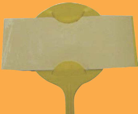
BOUTIQUE COLZA Jalon + plaque glutec Piège à insectes