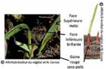
Ray-grass d'Italie plantule