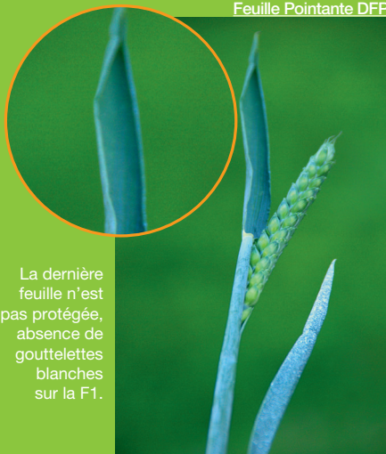
Photo du stade DFE après une application de la bouillie blanche au stade Dernière Feuille Pointante DFP