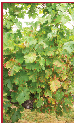
Témoin non traité