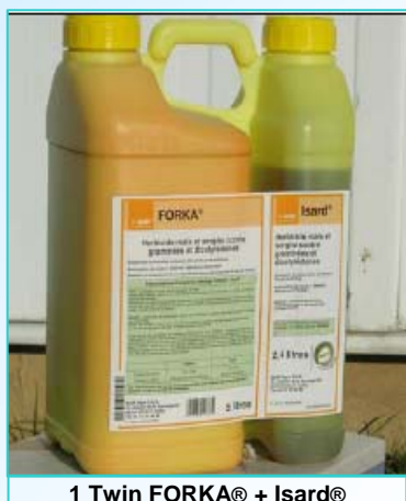
1 Twin FORKA® + Isard®

Twin FORKA® + Isard® pour désherber MAÏS ENSILAGE et MAÏS GRAIN 2 ha par Twin