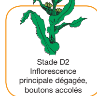
Stade D2 Inflorescence principale dégagée, boutons accolés