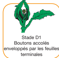
Stade D1 Boutons accolés enveloppés par les feuilles terminales