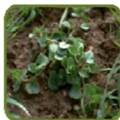
véronique F. de lierre

PICOSOLO apportera un haut niveau d'efficacité notamment sur