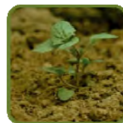
véronique de Perse