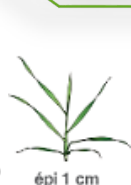
épi 1 cm

* Dose à ajuster au niveau de risque (sensibilité variétale, pression)