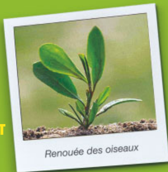
Renouée des oiseaux