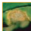
Macule de phoma avec ses pycnides