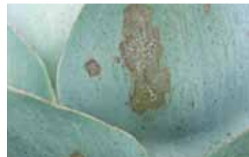
Symptômes sur capitule