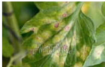
Symptômes sur feuilles

Facteurs favorisants : pluies et rosées, forte hygrométrie (> 90%), températures comprises entre 10 et 25°C, la proximité de cultures de pomme de terre, les apports d'azote en fin de cycle. Par contre le champignon est détruit par une sécheresse persistante et des températures avoisinant 30°C.