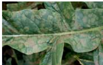
Symptômes sur feuilles

Facteurs favorisants : les conditions douces, humides et fréquemment pluvieuses, la présence d'eau libre sur un feuillage particulièrement vigoureux et dense favorise le développement de la maladie.