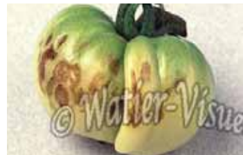
Symptômes sur fruits