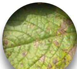
Taches brun-forcé circulaires ou angulaires, constituées d'anneaux concentriques plus ou moins visibles