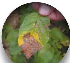
Formation de zones nécrotiques plus étendues