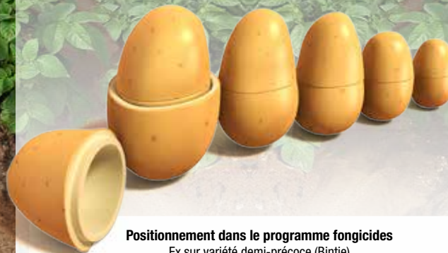
Positionnement dans le programme fongicides Ex sur variété demi-précoce (Bintje)