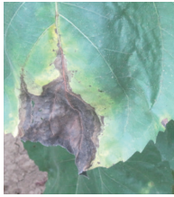
Début de l'infection sur feuilles