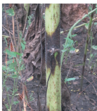
Infection brune sur la tige au niveau du point d'attachement des feuilles