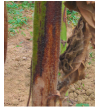
Les lésions sur la tige n'ont pas de délimitation nette

SYMPTÔMES : les 1 ers symptômes se manifestent sur la bordure des feuilles sous forme de taches brunes qui progressent vers le centre de la feuille. Sur la tige, une tache brun-rougeâtre entoure la base du pétiole. En conditions favorables, elle va encercler la tige, ce qui provoque un échaudage du capitule et la casse de la tige.