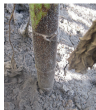
Tache noire provoquée par une attaque du collet.

SYMPTÔMES : le phoma peut se manifester sous deux formes : attaque au niveau du collet et symptômes sur feuille et tige. L'infection est caractérisée par des taches noires sur la tige autour du point d'attachement de la feuille. Les taches noires peuvent évoluer des feuilles vers la tige. Dans le cas d'une attaque forte, l'infection conduit au noircissement complet de la tige.