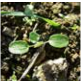
Véroniques feuille de lierre

Grâce à l'association du tritosulfuron et du florasulam, Canopia® apporte un haut niveau d'efficacité sur gaillets mais également sur dicotylédones telles que matricaires, coquelicots, crucifères, stellaire, séneçon, lamiers, capselles, myosotis et véroniques feuille de lierre.