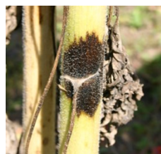
Symptômes sur la tige Tache encerclante.

Flétrissement brutal du feuillage puis sénescence 15j. à 1 mois avant la maturité physiologique normale.