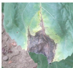
Symptômes sur feuille Progression le long de la nervure centrale.

10% de plantes avec une tache encerclante de phomopsis sur la tige suffisent à faire perdre 1 à 3 q/ha et 1 point d'huile .