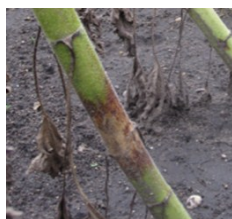
Symptômes sur la tige Tache brun-rouge centrée sur le point d'insertion de la feuille.