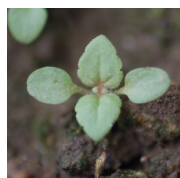
véronique de Perse