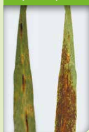
A gauche : face inférieure. A droite : face supérieure

Les feuilles supérieures et plus particulièrement la dernière feuille sont exposées à des stress non parasitaires provoquant de grandes zones brun violacé d'une multitude de ponctuations. Seule la face supérieure exposée à la lumière présente des grillures (les grillures ne traversent pas les feuilles).