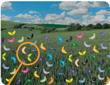
Souches de Septoria tritici

TEMPS 2 : traitement avec un seul triazole