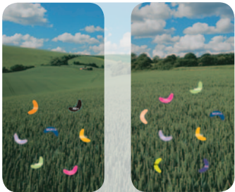
avec époxiconazole avec metconazole

TEMPS 2 : traitement avec un seul triazole