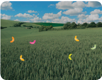
avec époxiconazole et metconazole

TEMPS 3 : traitement avec les deux triazoles associés