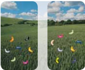
avec époxiconazole avec metconazole Appliqués seuls, l'époxiconazole ou le metconazole contrôlent préférentiellement certaines souches.

TEMPS 2 : traitement avec un seul triazole