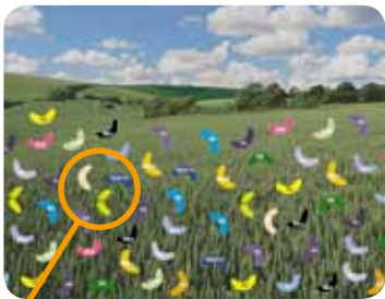
Souches de Septoria tritici

TEMPS 2 : traitement avec un seul triazole