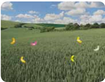
avec époxiconazole et metconazole Associés, comme dans le produit Osiris® Win, les 2 triazoles contrôlent un plus grand nombre de souches, limitant ainsi la sélection massive de certaines souches.

TEMPS 3 : traitement avec les deux triazoles associés