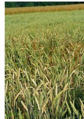
Symptôme sur plante adulte