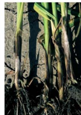
Pieds attequés par le piétin-verse