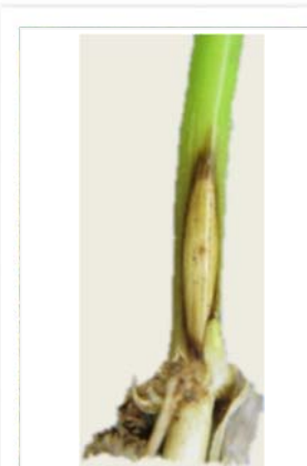
Symptôme sur tige après retrait des gaines