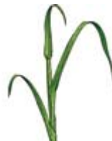
Dernière feuille étalée - Gonflement