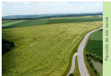
Parcelle de blé versé

Ceci vous permettra de préserver l'état sanitaire de la F2 contre la rouille brune et la septoriose.