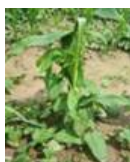
Liseron des haies Rumex de semis