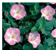
Liseron des champs