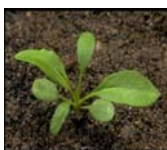
Capselle bourse à pasteur