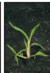
Panic pied de coq