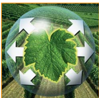
Effet diffusant : une protection immédiate et durable de la feuille.

(les feuilles traitées face supérieure sont protégées également sur la face inférieure et inversement), apportent une bonne couverture et une longue persistance d'action.